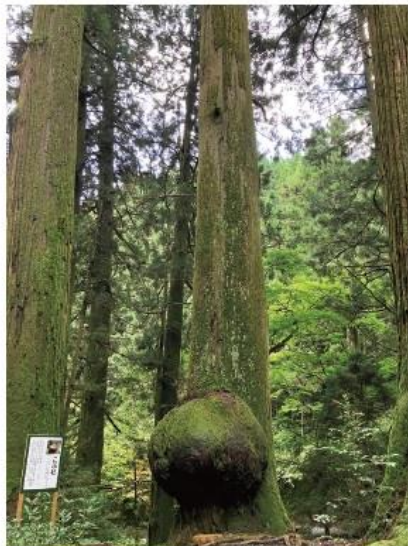
花園神社の御神木「こぶ杉」

7kmに渡る自然豊かな溪谷の景観を車窓から楽しめます。途中の水沼ダムや花園神社周辺の紅葉も見どころです(見ごろは11月中旬)。花園神社は駐車場完備。徒歩でのんびり散歩してみたいかがでしょう。常磐道北茨城ICより約20分。