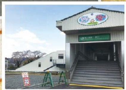
↑富岡町夜ノ森駅東口(建て替え後)