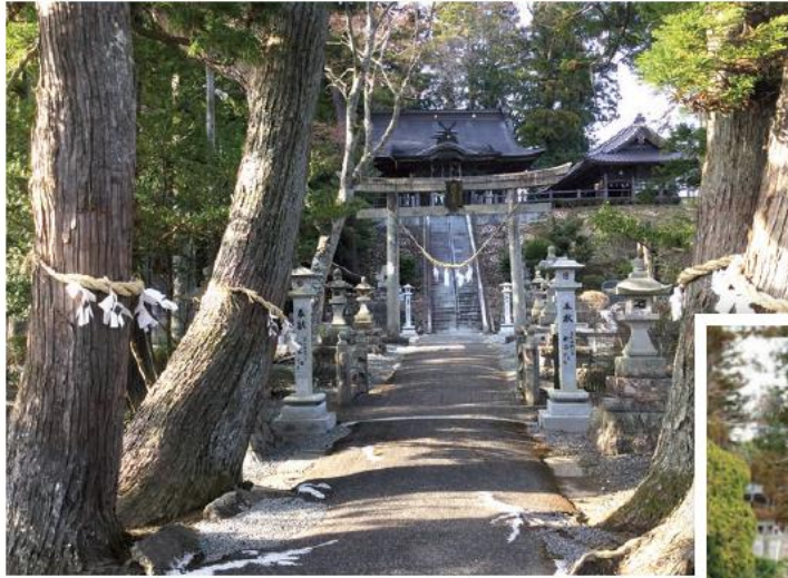
←南相馬市原町区太田神社