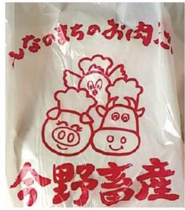
↑南相馬市磐城太田駅近くのお肉屋さん