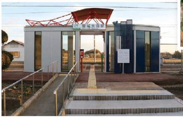
↑南相馬市磐城太田駅