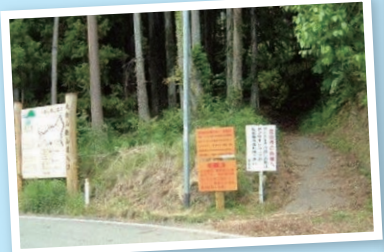
↑富岡町大倉山山道入口

おおくらさん 大倉山(標高593m) 昔、山道は「塩の道」と呼ばれて、仏浜(富岡漁港)に陸揚げされた物資を川内村、三春町、二本松市に運ぶ重要な道だった。