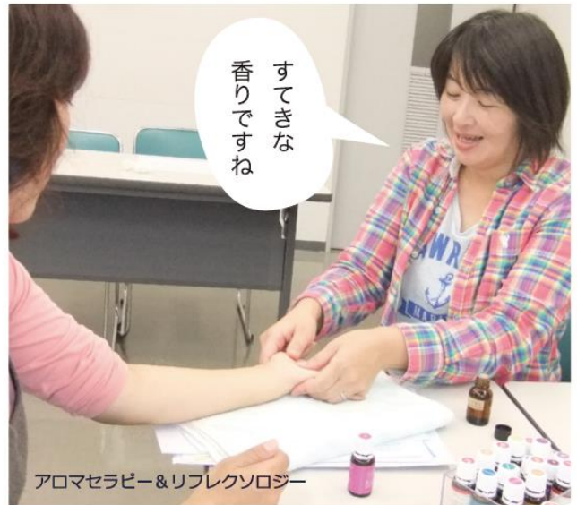
アロマセラピー&リフレクソロジー

スを利用できるようになりました。自分の時間が取れるようになった頃に「福島乳幼児妊産婦ニーズ対応プロジェクト茨城拠点」のイベントに参加して茨城県内への避難者・支援者ネットワーク「ふうあいねっと」があることを知り、12月に交流会を通して知り合った避難ママと地元ママで「ふうあいママの会」を作り、月に1回ほっこりとした交流会を開いていました。それは心身ともに疲れ果てた、私の心の支えと安らぎになりました。