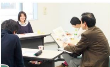
▲講演会「子ども子育ての今とこれから」