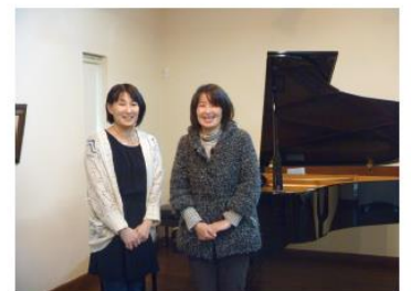
▲ウェディングピアニストの友人と