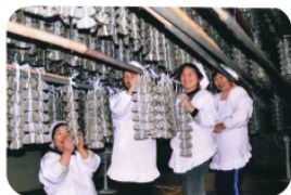
もちカーテンの中で