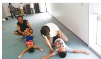
▲体と心をほぐすストレッチ運動