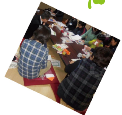
小さい子どもさん連れも参加。学校での手続きのことなど、これからのことをいろいろ聞くことができました