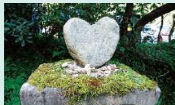
鳥居の近くにこんなかわいらしい石が置かれていました！

御岩山 標高492m 登山所要時間 往復90分 御岩神社⇔日立中央ICから10km、日立駅から12km