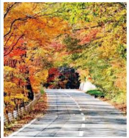
↑帰還困難区域内 高瀬川溪谷