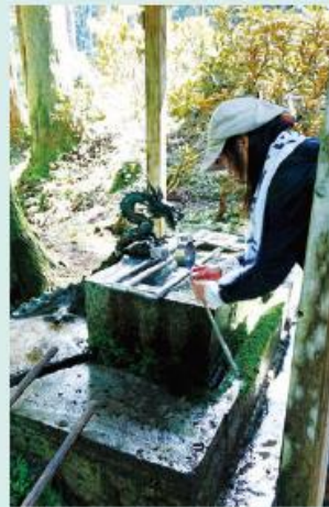
ちょうずや 手水舎 龍神さま (雲や雨を司る水の神様)

写真撮影する際は逆光で撮ってみてください！ もしかしたら龍らしき姿が写るかもしれません！？