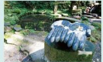
心洗 この水で心を清めることができるのでしょね。