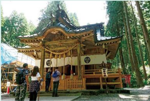
拝殿 参拝の仕方。二礼二拍一礼。

御岩神社の建立されている御岩山は古来より神々が棲む聖地として、崇められてきた霊山だそうで、強く厳格な正気の満ちたパワーに満ちているそうです。