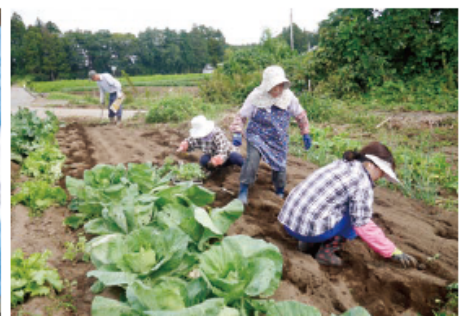
キャベツの作付けを行いました。